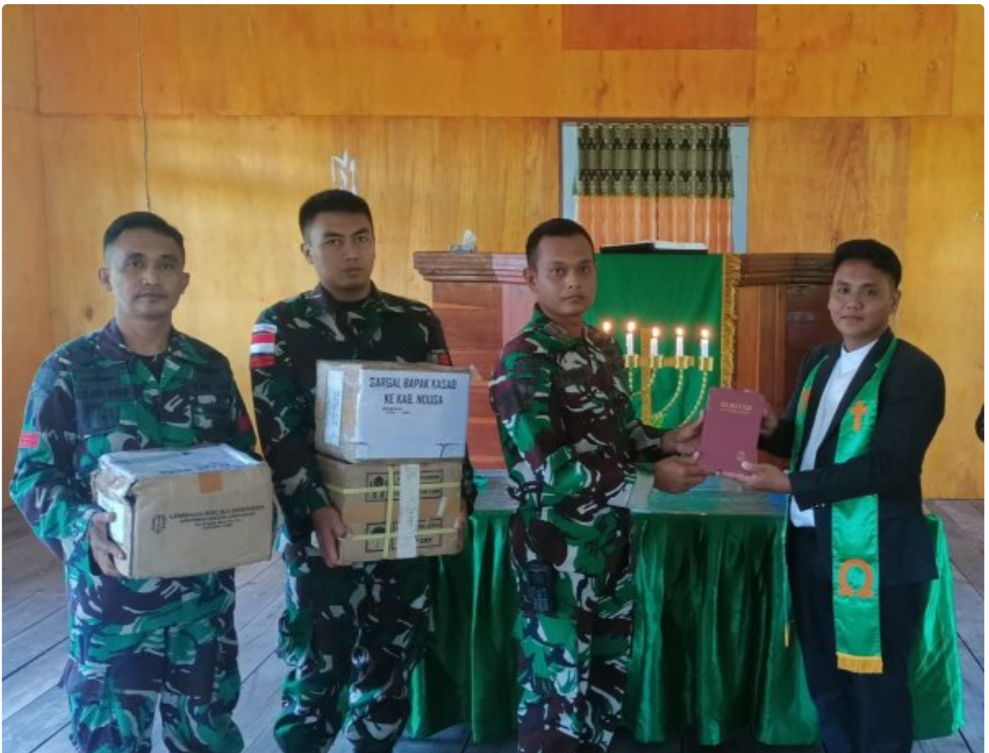
Foto: Satgas Yonif 503/Mayangkara kembali menunjukkan dedikasinya kepada masyarakat di Papua dengan memberikan dukungan alat musik untuk kegiatan ibadah di Gereja GKI Bethesda Batas Batu, Distrik Krepkuri, Kabupaten Nduga. Pada Minggu, 12 Januari 2025.